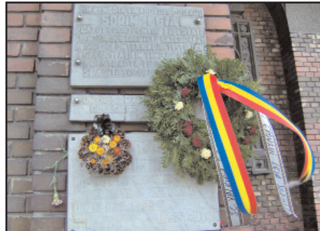
Placa memorială de la intrarea în Catedrala Mitropolitană