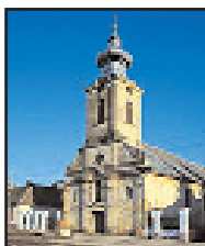
Biserica romano-catolică din Peciu Nou (Ulbach), 1776-1778

Datează din a doua jumătate a mileniului al II-lea î.Ch. Este expus la Muzeul Banatului din Timișoara.