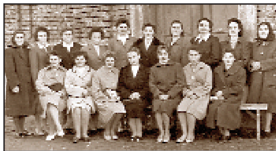
Corul de femei din Johannsfeld - mijlocul secolului XX

Anul 2005 a fost deosebit de greu pentru locuitorii din Otelec: inundații catastrofale au afectat, conform unei statistici făcute de autoritățile locale, 219 proprietari de case. 34 de case au fost avariate în proporție de peste 50 la sută, iar în jur de 180 s-au prăbușit. Doar câteva, patru sau cinci, au rămas în picioare, deși au fost inundate. Casele avariate grav și cele prăbușite erau construite din văiuță, în timp ce locuințele inundate, dar rămase întregi, erau construite din căramidă arsă.