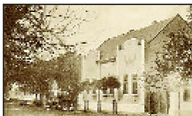
Satul Otelec în anul 1918