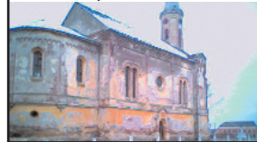
Biserica catolică din Moravița, în paragină

șezată deasupra ușii lăcașului de cult ca piatră de onorare (printre faptele episcopului se numără sfințirea bisericii ortodoxe române din Răcășdia, în anul 1778, ca și sfințirea bisericii ortodoxe române din Oravița Montană în anul 1784). În anul 1911 coloniștii șvabi au dărâmat însă biserica ortodoxă română, iar piatra de onorare a fost lăsată în părăsire în fața unei case din sat. Piatra a fost ridicată abia în anul 1923, dusă la Timișoara și păstrată azi în colecția de obiecte bisericești și de artă a Mitropoliei Banatului.