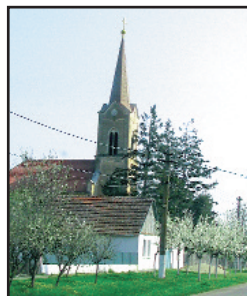
Biserica romano-catolică din Conacul Iosif (foto) nu va mai fi singura din sat. În primăvara lui 2009 a început construcția bisericii ortodoxe române.

munei Lenauheim, iar românii i-au spus Conacul Iosif. Acum este locuit de români (majoritari), de maghiari și de câteva familii de romi.